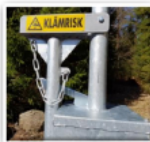
Lyftbom, klar för stängning i upplåst läge.