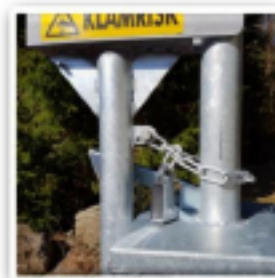
Lyftbom, låst med kätting och hänglås i öppet läge.

Tänk på att aldrig ha fingrarna i klykan där motviktsrör (C) lyfts och sänks mot moder stolpe (A) då det finns en klämrisk här! Använd kättingen för låsning med hänglås av bommen i öppet läge!