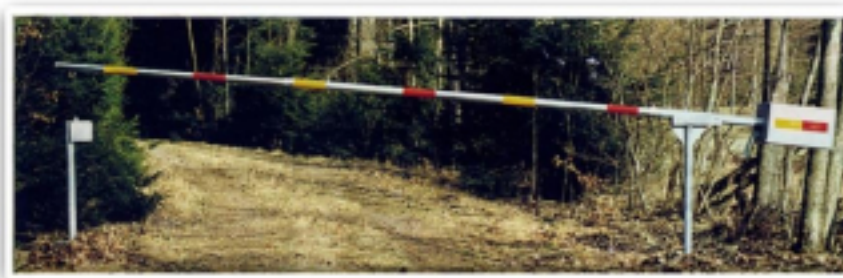
Lyftbom med motviktsbehållare fylld med grus till jämnviktsläge.